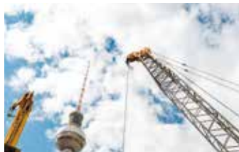
■ Seilanwendungstechnik Rope Application Technology