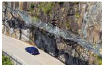
■ Schutzverbauungen PFEIFER ISOFER Natural Hazard Solutions PFEIFER ISOFER