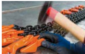
■ Anschlag-/Zurrtechnik Attachment and Lashing Equipment