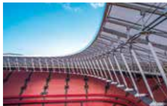
■ Leichtbau Architektur Lightweight Architecture