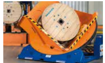
■ Hebeteknik Lifting Technology