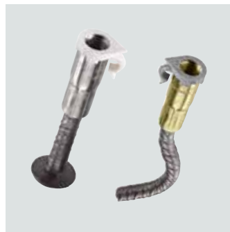
DB-Anker für Dauerbefestigungen